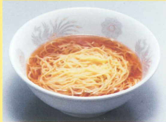
麺の食塩量は0.3g (スープ220cc)