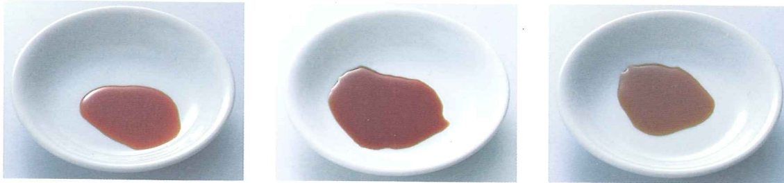
しょうゆ ひとかけ